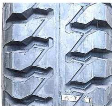
Hình 4: Mẫu vân lốp