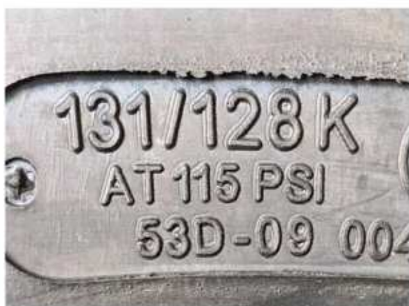
Hình 3: Chỉ số khả năng chịu tải và cấp tốc độ