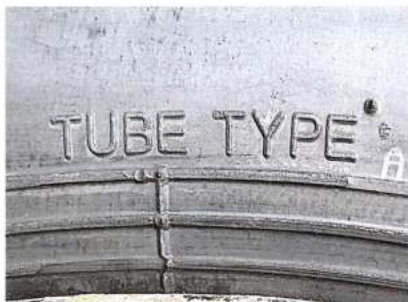
Hình 5: Lốp là loại có/không sử dụng săm