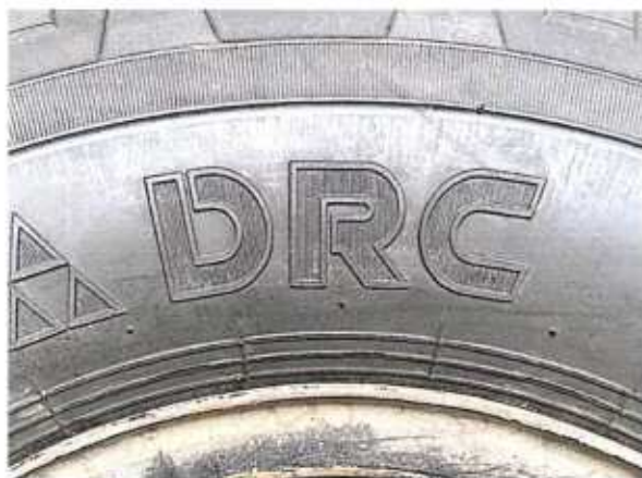
Hình 1: Nhân hiệu