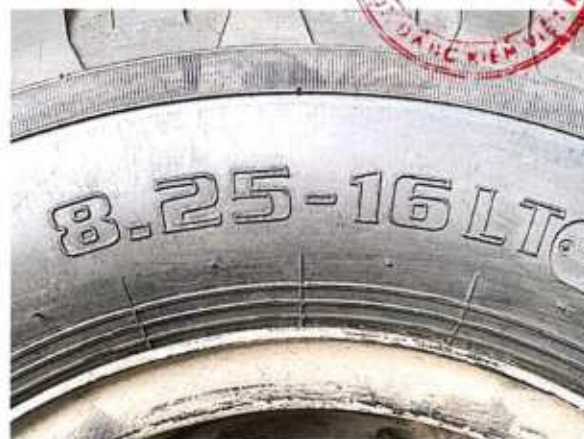
Hình 2: Ký hiệu kích cỡ lốp