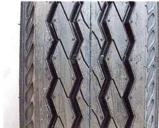
Hình 4: Mẫu vân lốp