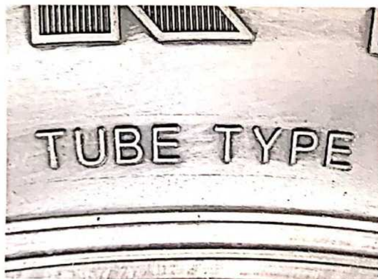
Hình 5: Lốp là loại có/không sử dụng săm