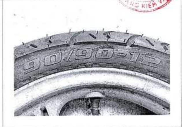
Hình 3: Chỉ số khả năng chịu tải và cấp tốc độ