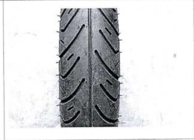
Hình 5: Lốp là loại có/không sử dụng săm