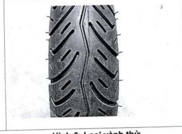
Hình 5: Lốp là loại có/không sử dụng săm