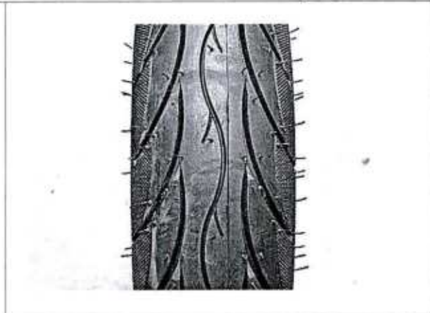
Hình 5: Lốp là loại có/không sử dụng săm