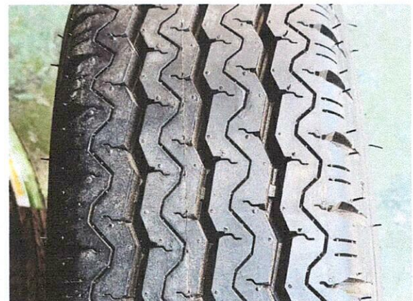
Hình 4: Mẫu hoa lốp